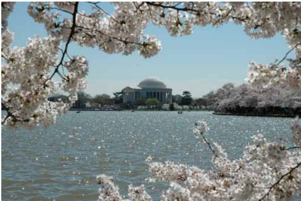
ワシントン・ポトマック河畔の桜