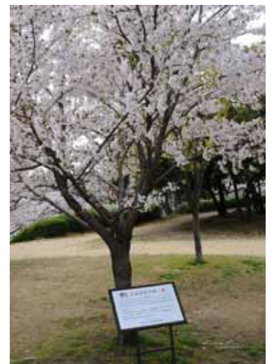
寄贈 90周年に米国より贈られた里帰り桜(伊丹市瑞ヶ池公園内)

100周年を迎えるにあたり、日米の友好をさらに進めるとともに、当時の台木づくりの物語を振り返り、伊丹の歴史と苗木づくりを広くPRするため、市民の参画と協働のもとに、100周年記念行事を行います。